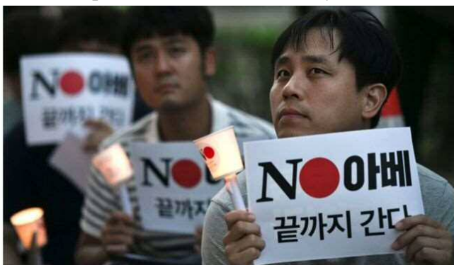
「No Abe (ノー、安倍)」と書かれたカードを手に「ホワイト国」除外に抗議する韓国人々

この緊急事態を受けて、アジア外交についての第一人者である浅井基文氏から「日韓関係を破壊する安倍政権」というテーマで、この問題の本質を考える講演をいただきます。ぜひとも多くの皆様のご出席をお願い致します。